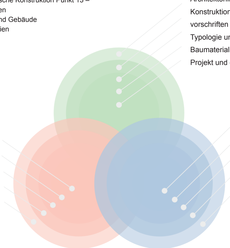
Diagramm 3 zeigt die 15 im Diagramm platzierten Kompetenzpunkte.

In den folgenden Abschnitten werden diese 15 Kompetenzpunkte für jede der drei Ausbildungsstufen für den Beruf des*der Innenarchitekt*in näher beschrieben.